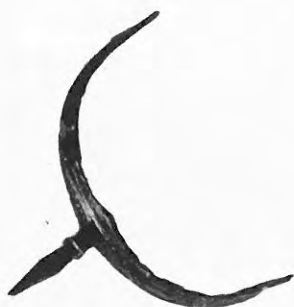
Εικ. 2-5. Χάλκινοι εχίνοι.