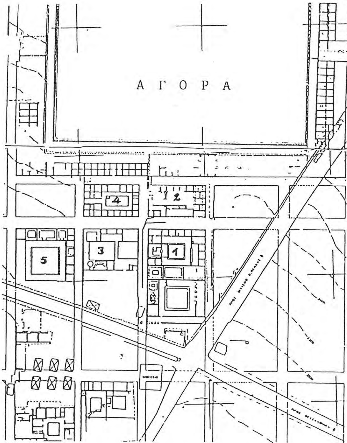
Σχ. 1. Κάτοψη του κεντρικού τομέα της Πέλλας, όπου και τα τετράγωνα 1, 2, 3, 4 και 5 (από τον οδηγό: Πέλλα, πρωτεύουσα των αρχαίων Μακεδόνων - 30 χρόνια ανασκαφής, 1957-1987).