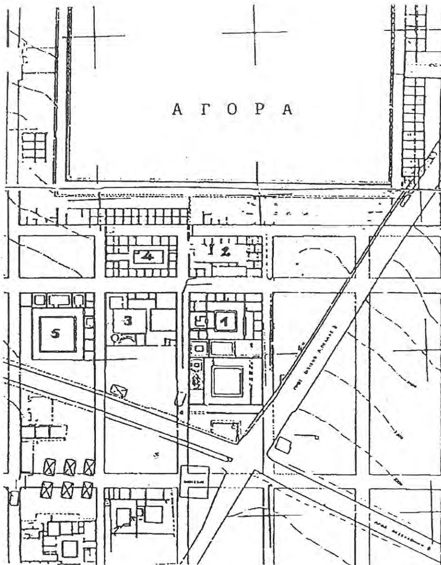
Σχ. 1. Κάτοψη του κεντρικού τομέα της Πέλλας, όπου και τα τετράγωνα 1, 2, 3, 4 και 5 (ἀπό τὸν ὁδηγό: Πέλλα, πρωτεύουσα τῶν ἀρχαίων Μακεδόνων - 30 χρόνια ἀνασκαφῆς, 1957-1987).