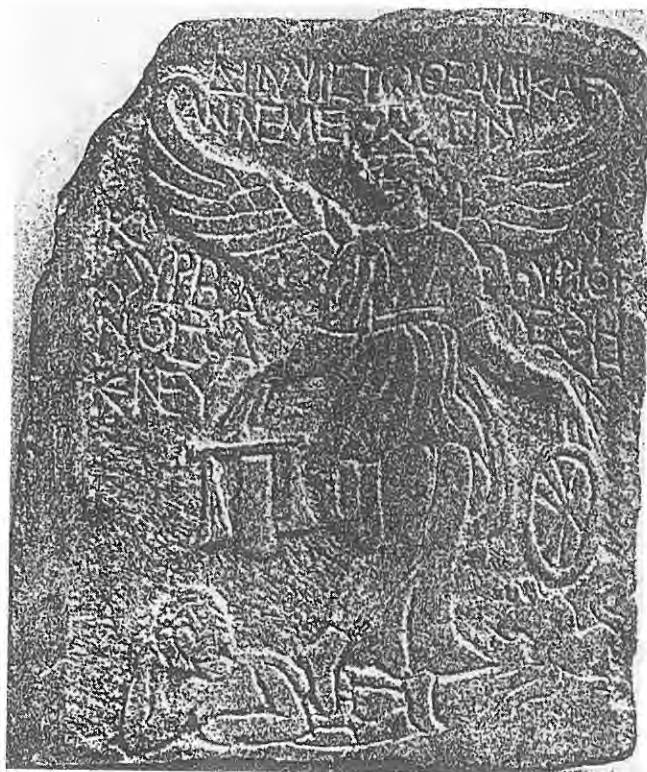
Εικ. 3α. IG X 2.1 62 ἡ θεά Νέμεισις κρατεῖ στο δεξι χέρι τὸν κλασικό, με δύο ἴσους βραχίονες, ζυγὸ.